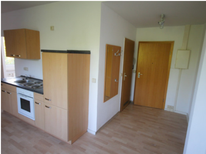
Flur und Wohnraum