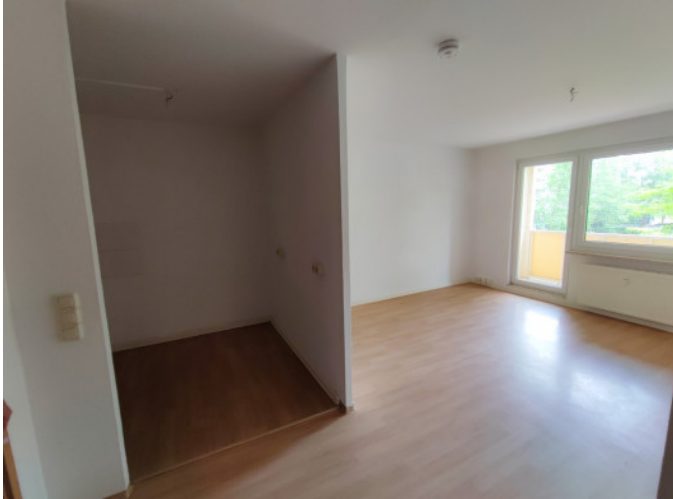
Wohnzimmer mit halboffener Küche

Wohnung, 3 Zimmer - Platanenstraße 32, 07549 Gera Lusan