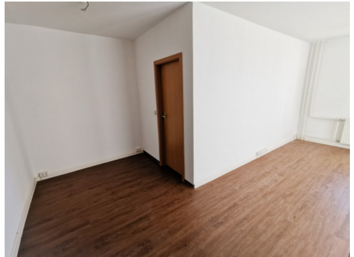
Essecke und Kinderzimmer 2