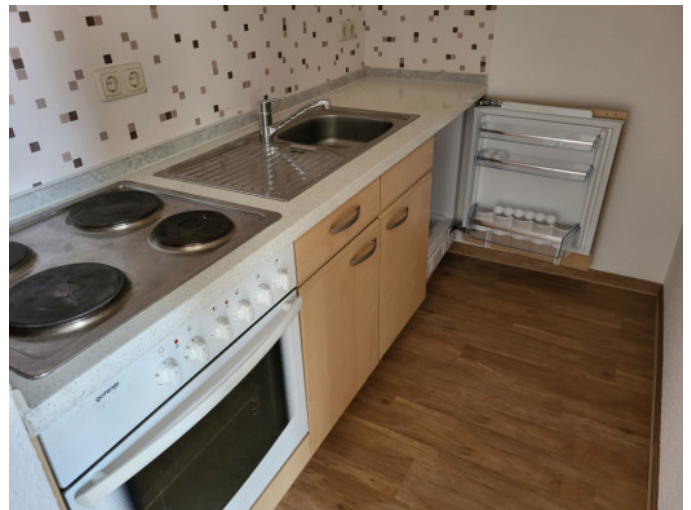
Kochnische mit Einbauküche