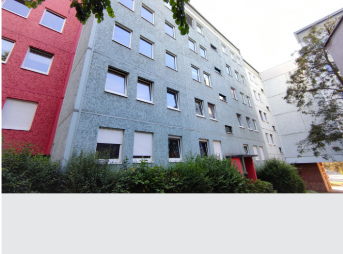
Ziegelberg 15, 13

Wohnung, 1 Zimmer - Ziegelberg 11, 07545 Gera Stadtmitte