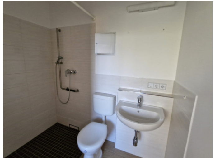
Bad mit ebenerdiger Dusche