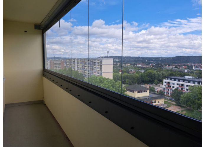
großer verglaster Balkon