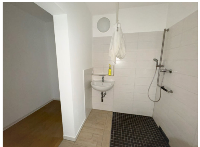
Badezimmer mit angrenzendem HWR