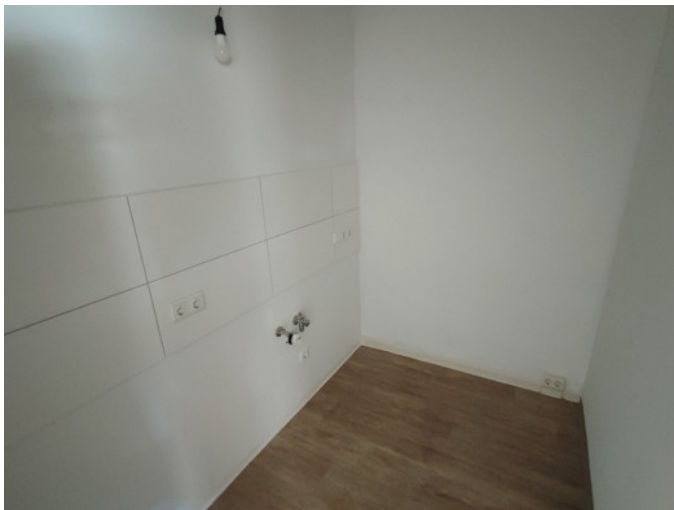
Küche mit Fliesenspiegel