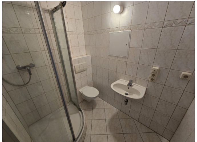
Badezimmer mit Viertelkreisdusche