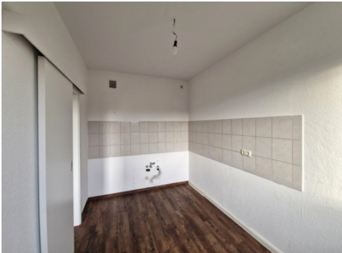
Küche mit Fliesenspiegel und Fenster