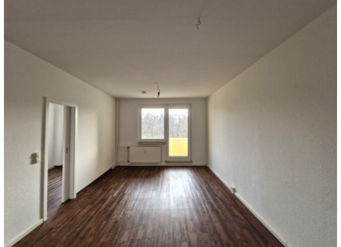
Wohnzimmer mit Balkonzugang