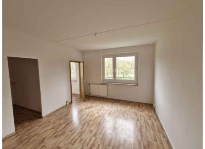
Wohnzimmer mit Schlafnische