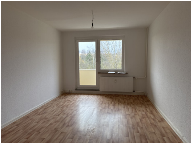
WZ mit Balkon