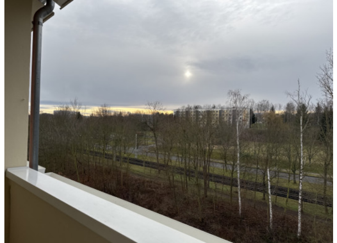
Blick vom Südbalkon