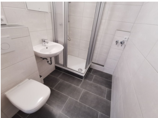
Bad mit Dusche und WM-Anschluss