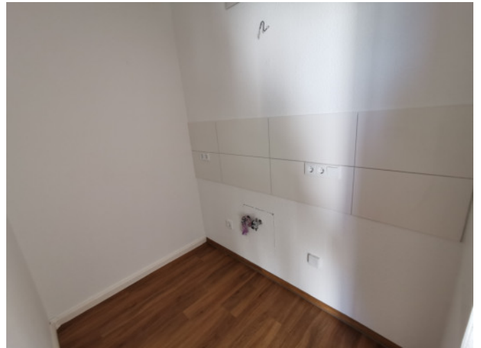
Küche mit Fliesenspiegel