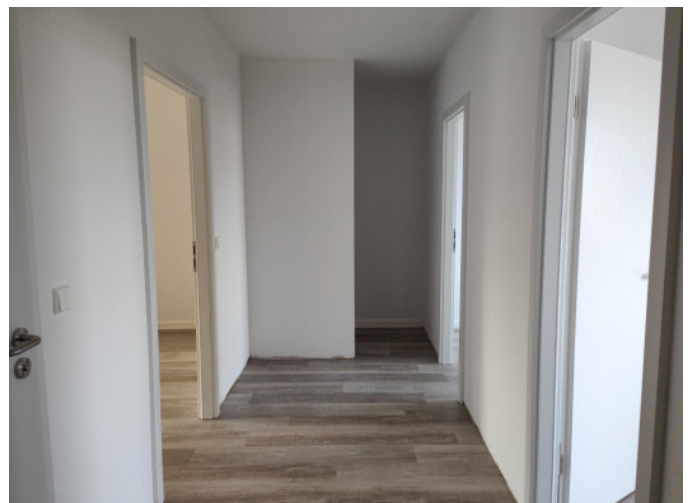
Flur mit Abtrennung