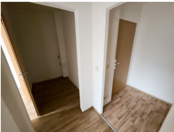
WM-Anschluss im Flur