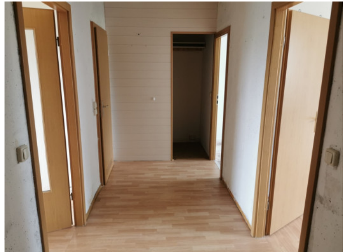
Flur mit Abtrennung