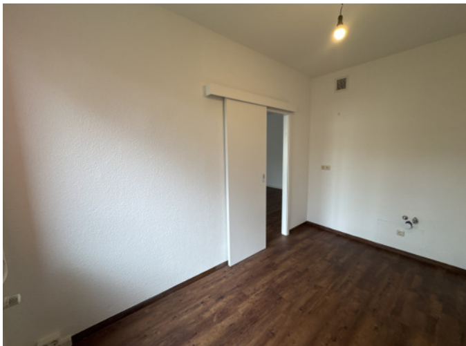
Küche mit Schiebetür