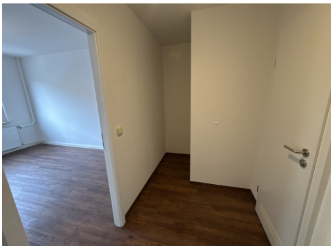
Flur mit Abtrennung