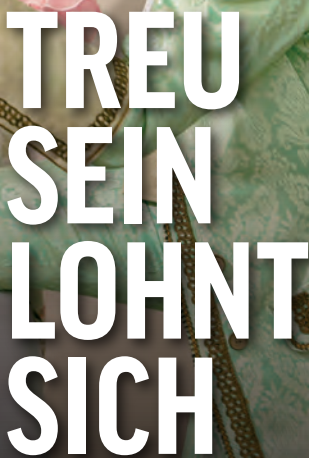
Der Barbier von Sevilla