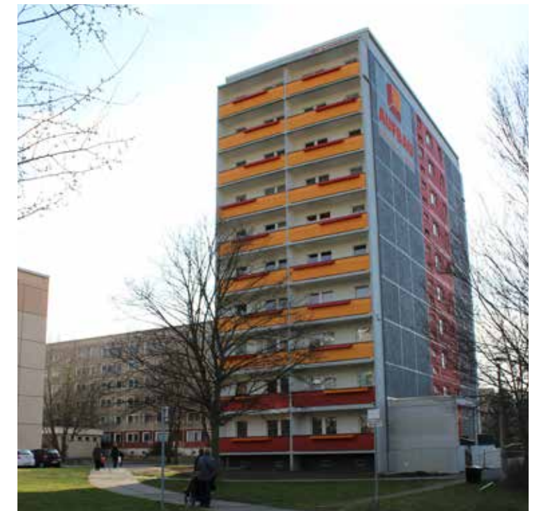
NEUGESTALTETE FASSADE IN DER PLATANE 9

Die neu gestaltete „Platanenstraße 9“ ist somit nicht nur optisch zu einem Hingucker geworden, sondern ebenso praktisch für alle, die ein barrierearmes Wohnumfeld zu schätzen wissen. Und das alles bei gleichbleibenden Nutzungsgebühren.